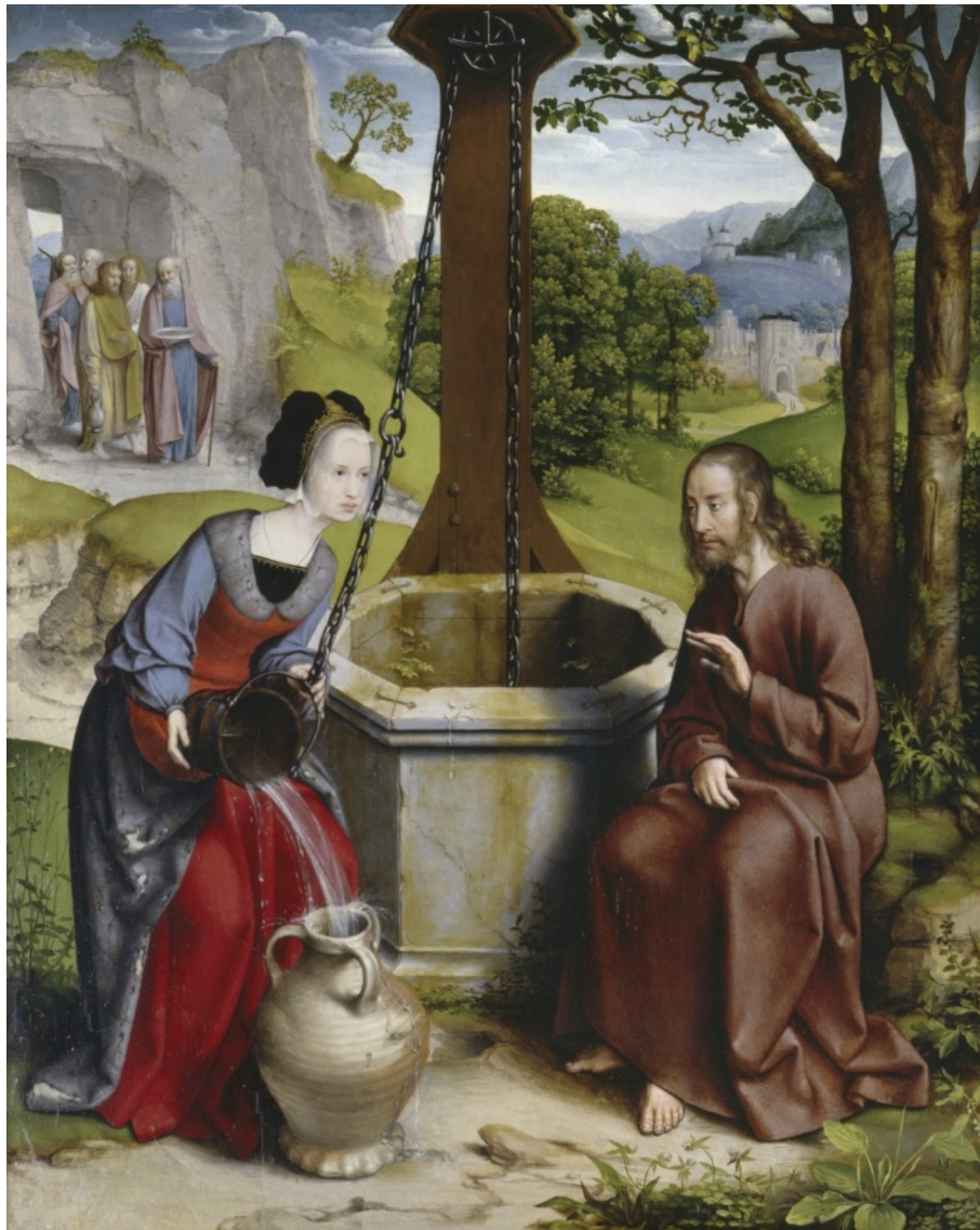
Johannes 4:5-26 Jezus en de Samaritaanse vrouw Jan Joest van Kalkar (±1450-1519)