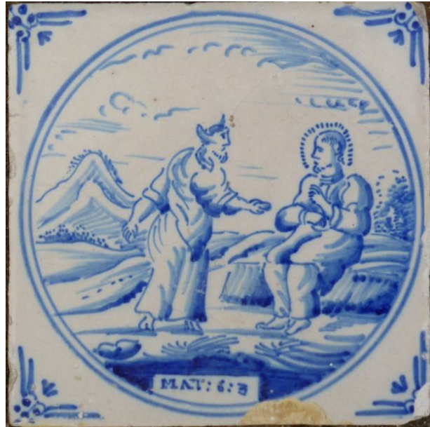
verzoeking in de woestijn